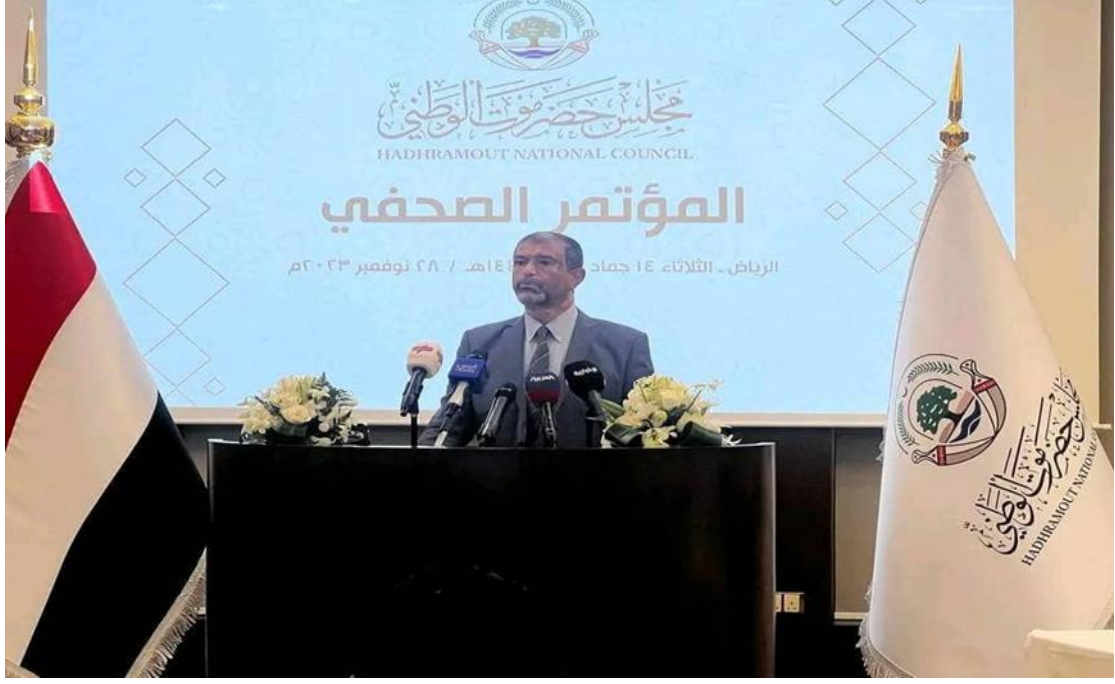
المؤتمر الصحفي لمجلس حضرموت الوطني في الرياض (رسمي)