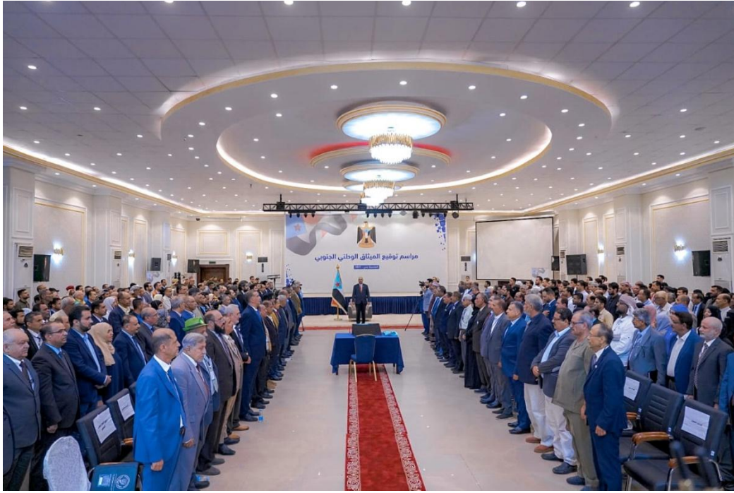
مراسم توقيع الميثاق الوطني الجنوبي (STC)

إجمالاً، يرى هاني مسهور أنّ استعادة الدولة الجنوبية "لم تعد فكرة"، بل هي "واقع حاضر"، حيث "باتت هذه الدولة تكاد تكون حقيقة"، وأنّه بإعلان "الميثاق الوطني الجنوبي" في الثامن من مايو 2023 وُضعت "الخطوط العامة" للدولة، ومنها "شكل الدولة". كما أنّ أبرز بنود هذا الميثاق الذي توصلت له القوى السياسية الجنوبية ينص على أنّ "دولة الجنوب تبنى على أساس الدولة الفيدرالية الديمقراطية المدنية العربية الإسلامية"، ذلك أنّ هذا التعريف يحاول "التماشي" مع واقع المنطقة العربية دون المساس بعمق الدولة، ما يعني أنّ الجنوبيين "يحاولون التماهي مع محيطهم الإقليمي" بدلاً من التصادم معه كما فعل "آباؤهم" إبان الدولة الجنوبية السابقة. 36