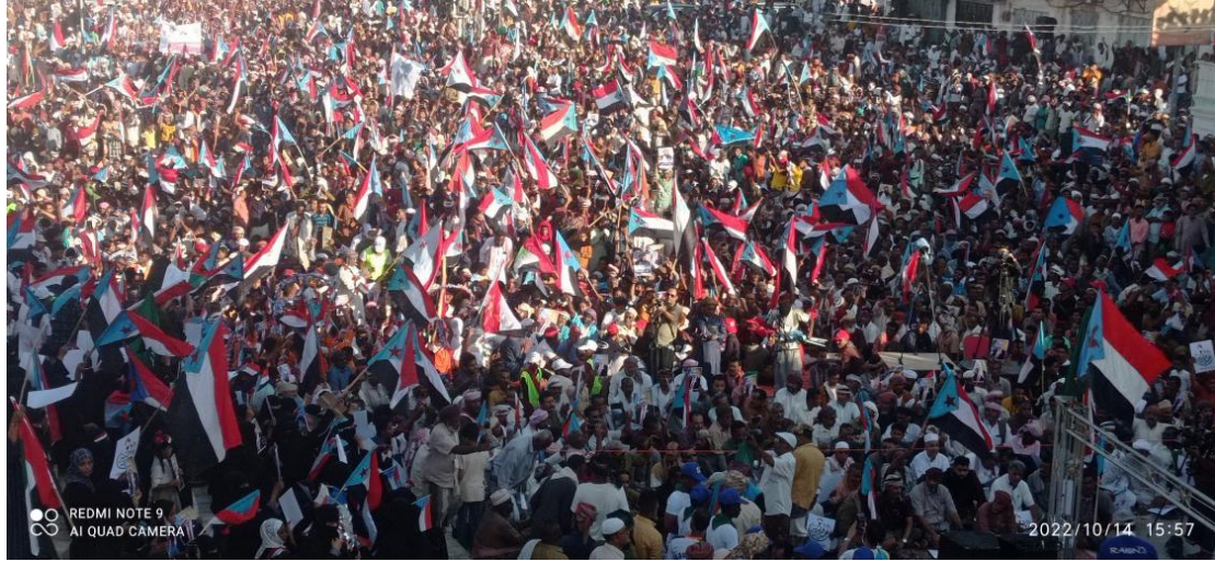
عشرات الآلاف تظاهروا الجمعة في سيئون بحضرموت، 14 أكتوبر 2022

ولديه قوات عسكرية "داعمة" هناك. كما أنّ نقطة ضعف التيار الحضرمي المؤيد لإقليم حضرموت ضمن مشروع اليمن، تكمن في أنه يقدم خطاباً يعتمد على "هياكل" الدولة اليمنية التي تشكلت بعد حرب صيف 1994 التي تُسيطر عليها القوى الشمالية وبشكل مطلق، كما يعتقد الكاتب الصحفي سعيد بكران. 19