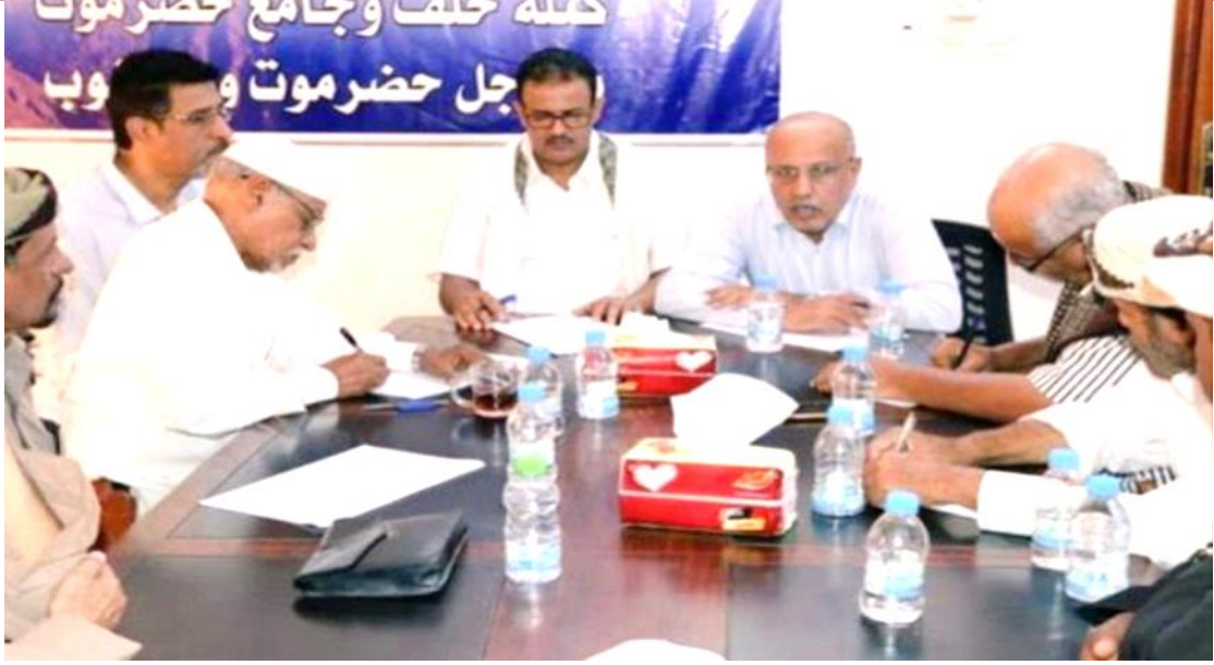
جانب من اجتماع الهيئة التنفيذية لكتلة حلف وجامع حضرموت (صوت المكلا)