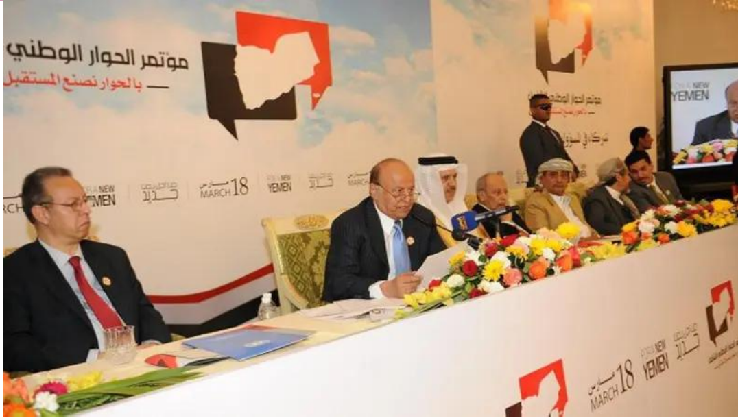
الجلسة الافتتاحية الثانية لمؤتمر الحوار الوطني