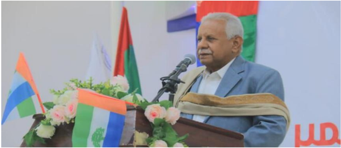
رئيس مرجعية حلف وجامع وادي وصحراء حضرموت، صوت حضرموت.