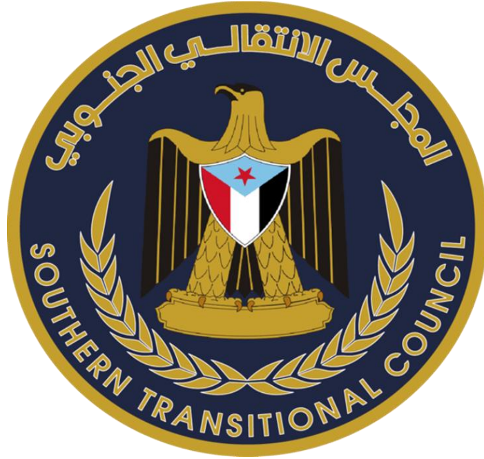
شعار المجلس الانتقالي الجنوبي، رسمي