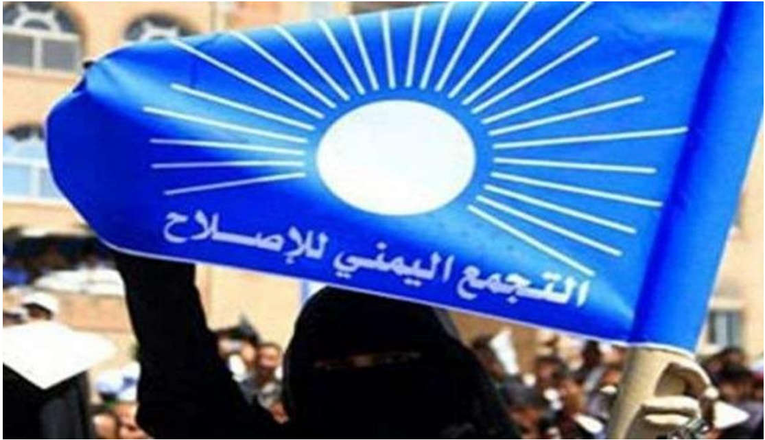
شعار حزب التجمع اليمني للإصلاح (رسمي)