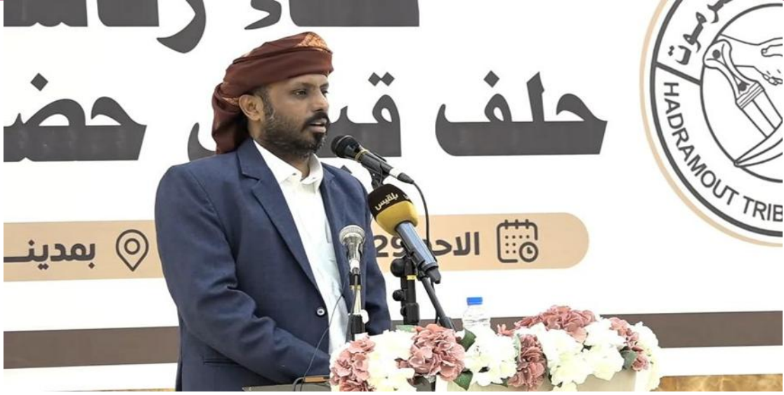
رئيس حلف قبائل حضرموت الشيخ عمرو بن حبريش.