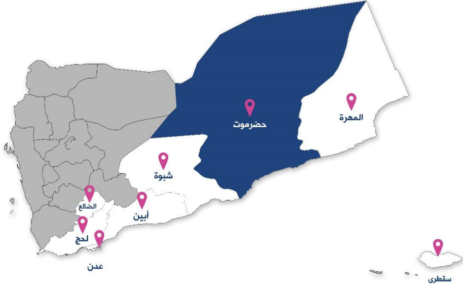
خريطة توضح محافظات جنوب اليمن، مركز سوٲ24.

الأصلح لحضرموت هو نظام الأقاليم، ولكن ضمن الدولة الفيدرالية الاتحادية اليمنية". 26