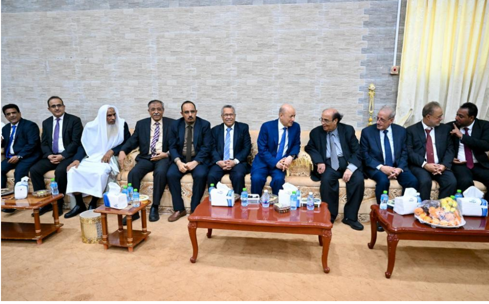
زيارة رشاد العليمي ووفد الحكومة إلى حضرموت في 25 يونيو 2023

وتمسكهم بالدولة ومؤسساتها، وعدم الخروج عن القوانين والدستور اليمني، وعدم الخروج عن التوافقات الدولية". 48